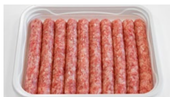
Saucisses fraîches en enveloppe d'alginate