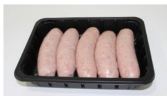
Saucisses fraîches en boyau naturel