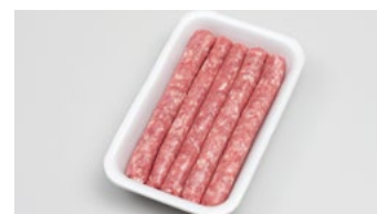
Saucisses fraîches en barquette polystyrène