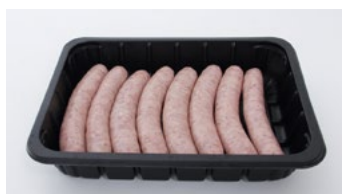
Saucisses fraîches en boyau naturel