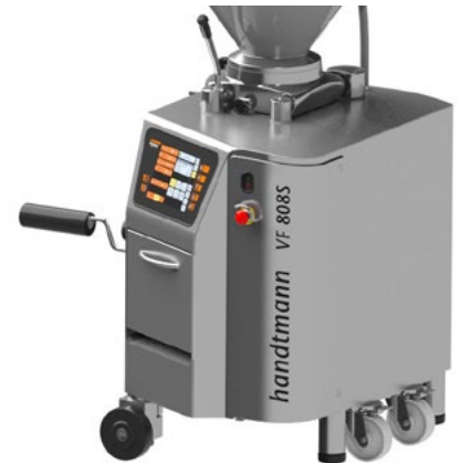
Chasis con ruedas