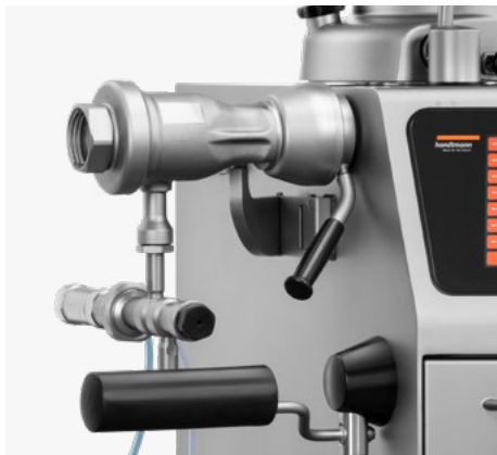
Cabezal de picado GD 455 con separador volumétrico