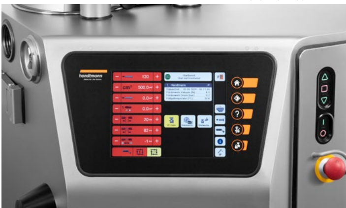
Control por monitor táctil