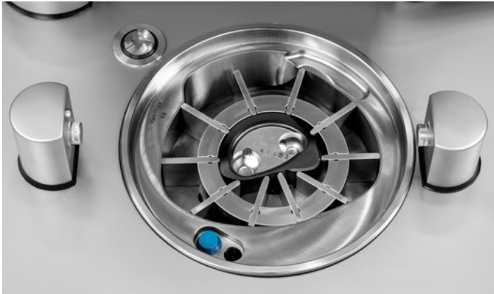
Rotor de paletas de la VF 808 S