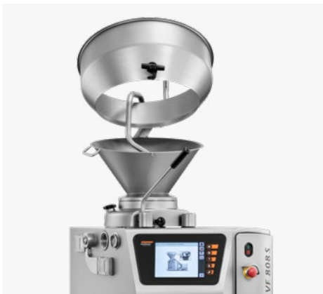
Tolva de llenado divisible de 40/100 litros