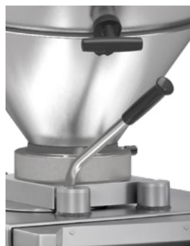
Elementos de comando VF 610 plus advanced edition para um trabalho ergonômico e higiene ótima