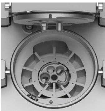
Bomba de massa com sistema de palhetas