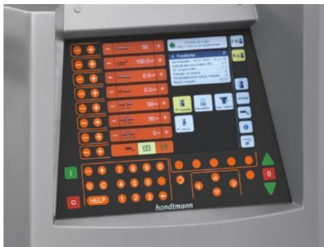
Steuerung mit Farbdisplay