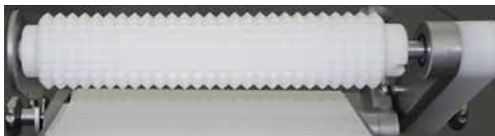
↑ Rodillo de estructura