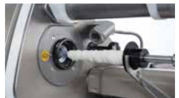
↑ optischer Darmdesensor