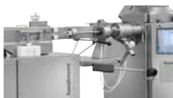
↑ Tritacarne da insacco GD 93-3