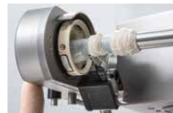
↑ Sensore di fine budello

Il principio di taglio dei wurstel su nastro con lama sincronizzata assicura porzioni divise in modo netto con estremità del budello chiuse. Tale affidabilità garantisce una produzione sicura, senza interruzioni. Il taglio individuale offre la possibilità di ottenere una certa varietà di prodotti, grazie ai ridotti tempi di preparazione macchina, spaziando da prodotti freschi fino a wurstel crudi.