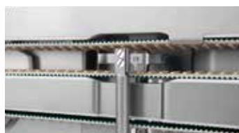
↑ Unità di taglio con modulo di taglio

Il principio di taglio dei wurstel su nastro con lama sincronizzata assicura porzioni divise in modo netto con estremità del budello chiuse. Tale affidabilità garantisce una produzione sicura, senza interruzioni. Il taglio individuale offre la possibilità di ottenere una certa varietà di prodotti, grazie ai ridotti tempi di preparazione macchina, spaziando da prodotti freschi fino a wurstel crudi.