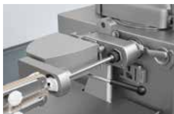
↑ Caricamento del budello con mano automatica e tubo di attorcigliatura

Il rotore a palette estremamente preciso della insacchiatrice sottovuoto Handtmann garantisce una porzionatura precisa al grammo e il caricamento costante della PLS 115. La mano automatica con azionamento a basso grado di usura e frena budello altamente preciso e flessibile (la corsa di ritorno per il doppio freno budello separa il punto di attorcigliatura per un risultato di taglio preciso) garantisce un'attorcigliatura delicata e veloce, anche nel caso di delicati budelli naturali.