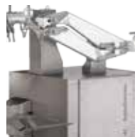
↑ Relèvement du niveau