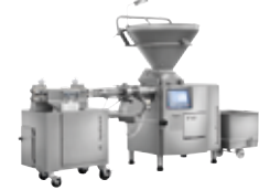
↑ PLSH 217 avec « Découpage »