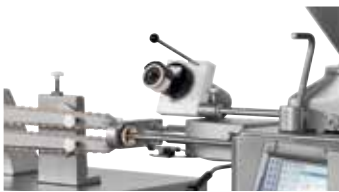
↑ Appareil à enfiler les boyaux