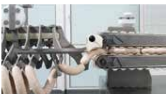
← Transfert vers l'unité de suspension

La PLH 216 place les saucisses fermées, comme portions droites ou courbées, avec le point de fermeture exactement sur le crochet de l'unité de suspension. Le nombre de boucles et de portions par boucle est paramétrable. Une grille serrée des crochets assure un chargement optimal des baguettes de fumage et donc la pleine utilisation des unités de fumage et de cuisson avec les économies en coûts et en énergie qui en découlent.