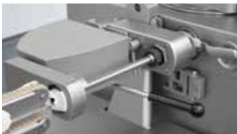
↑ Enfilage de boyaux avec main automatique et cornet de fermeture

La pompe à ailettes à haute précision du poussoir sous vide Handtmann garantit un portionnement au gramme près et l'alimentation constante de la PLH 216. La main automatique à entraînement à faible usure et le frein à boyaux sensible et flexible garantissent une fermeture douce et rapide même pour les fragiles boyaux naturels.