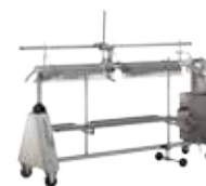
↑ Combinaison avec clippeuse