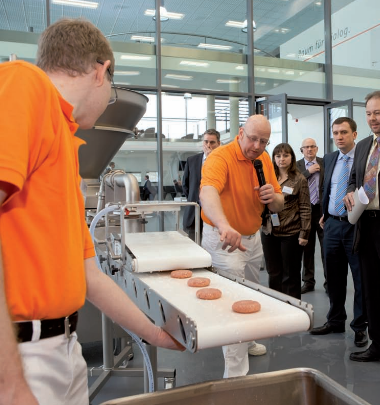
Das neue Handtmann Forum bietet auf über 1000 m 2 Raum für Inspiration und Innovation.