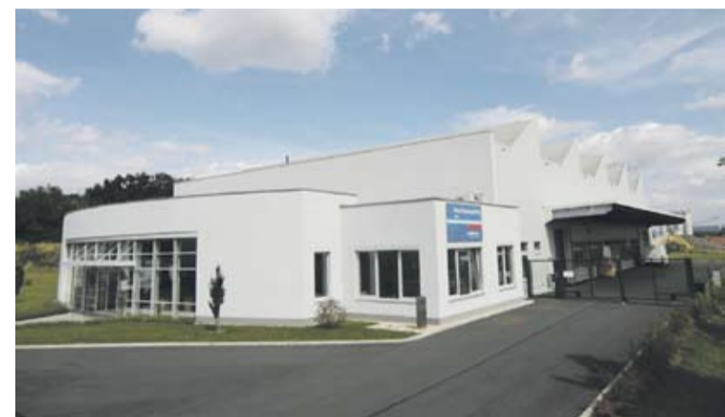
Handtmann Zittau: Das neu gegründete Tochterunternehmen der Handtmann Maschinenfabrik im ost-sächsischen Zittau überholt gebrauchte Fleischereimaschinen und verkauft diese wieder an Wurstfabriken in Schwelkenländern. Diese meist noch sehr jungen Unternehmen können sich damit schon früh von der Qualität der Handtmann Maschinen und Dienstleistungen überzeugen.