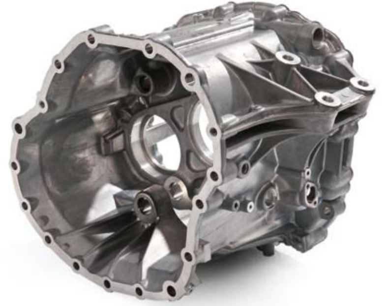
Das Metallgusswerk produziert beispielsweise solche Getriebegehäuse – so präzise und solide, dass sie ein ganzes hartes Lkw-Leben halten. Gewicht: 22 kg.

Neben Aluminium nutzt man bei Handtmann auch das weitreichende Potential des Leichtbauwerkstoffs Magnesium. Mit dessen Hilfe sparen Automobilhersteller deutlich an Fahrzeuggewicht ein, und erzielen so zusätzliche CO 2 -Reduzierungen. Damit lassen sich die gesetzlichen Abgasnormen erfüllen.