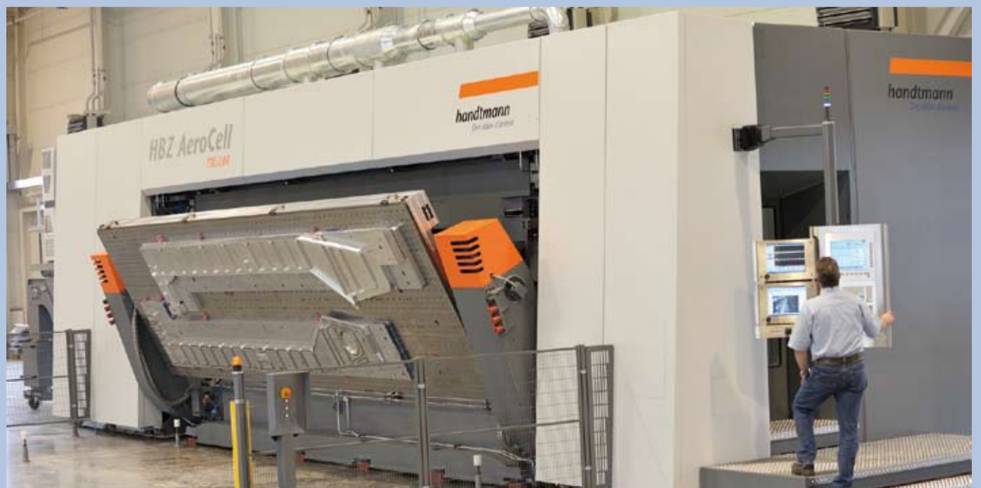
Bearbeitungszentrum mit integriertem Palettenwechselsystem. Maschinengewicht 120 Tonnen.

Nach der Wirtschaftskrise steigert sich die internationale Nachfrage nach unseren technologisch anspruchsvollen Maschinen wieder so rasant, dass wir besonders heute attraktive Jobs mit Perspektiven bieten können.