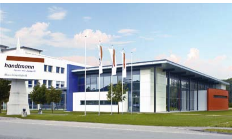
Das neue Handtmann-Forum der Maschinenfabrik im Biberacher Gewerbegebiet Aspach.