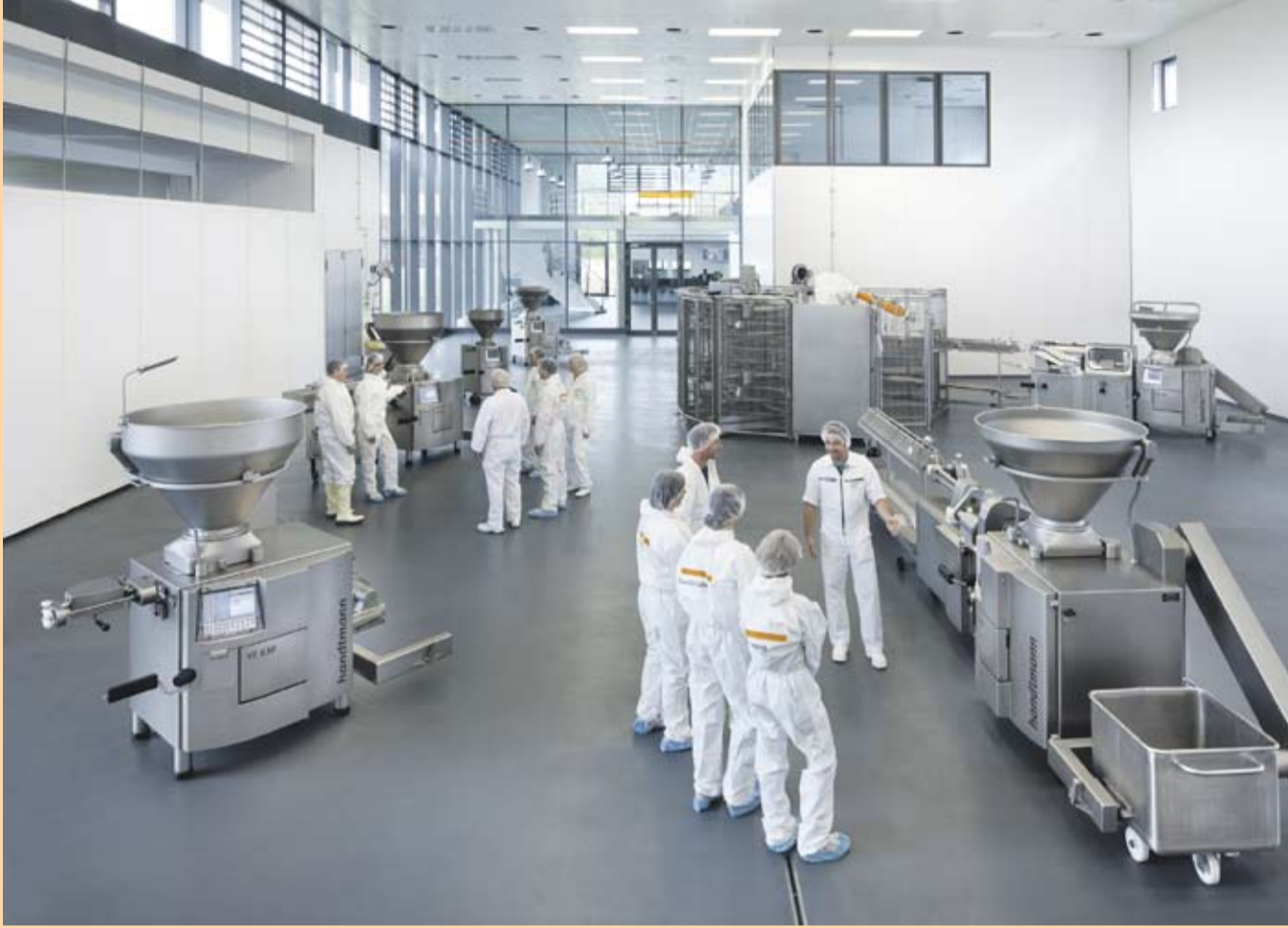
Der Vorführraum im Handtmann Forum erfüllt alle weltweit gültigen Hygiene- und Sicherheitsanforderungen zur Verarbeitung von Lebensmitteln.

Die Handtmann Maschinenfabrik beschäftigt sich seit fast 60 Jahren mit der Entwicklung, Herstellung und dem Verkauf von anspruchsvollen Maschinen zum Abfüllen und Portionieren von hochwertigen Lebensmitteln. Weltweit arbeiten tausende Handwerksbetriebe und große, internationale Industriekonzerne mit bis zu 50.000 Mitarbeitern mit Maschinen und Systemen der Handtmann Maschinenfabrik. Sie stellen damit das gesamte weltweit angebotene Sortiment an Wurstwaren her und füllen diese in alle am Markt verfügbaren Därme wie z. B. Naturdärme, essbare Kunststoffdärme, Faserdärme, Kunststoffdärme oder in Becher und Schalen. Auch andere Fleischprodukte wie Schinken, Hackfleisch, Hamburger und Pasteten werden mit