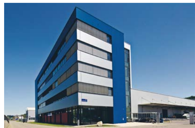
Handtmann hat seine Armaturenfabrik um etwa ein Drittel vergrößert: Die ganze Verwaltung ist durch den Neubau jetzt eng an die Produktion angeschlossen.

sind nun auch räumlich direkt an die Produktion angeschlossen. Ziel dieser Innovations-sprünge war es, die Wettbewerbsfähigkeit auf den internationalen Märkten zu sichern. Die Umsatzzahlen belegen, dass das gelungen ist. In den vergangenen zwölf Jahren hat Handtmann ca. 500 Mio. Euro in Grundstücke, Gebäude und Maschinen investiert. Das gesamte Firmenareal beträgt 500.000 Quadratmeter. Davon sind 250.000 Quadratmeter mit modernen Gebäuden für Verwaltung, Entwicklung, Produktion und Vertrieb überbaut.