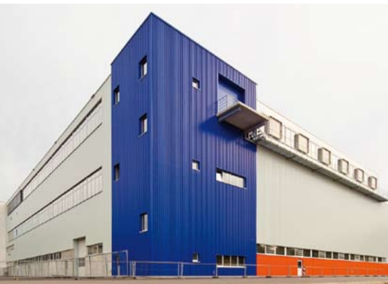
Erweiterung der Druckgießerei um ca. 5000 m 2 , Druckgussmaschinen mit 3.500 to und 4.000 to Schießkraft werden installiert.