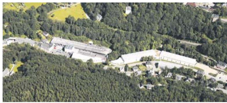
Die Handtmann Leichtmetallgießerei Annaberg wurde in den letzten Jahren ausgebaut und modernisiert.