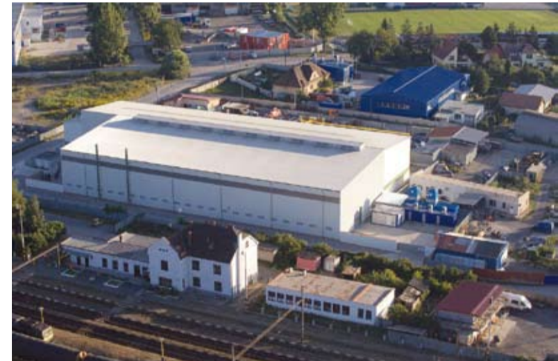
Ebenfalls auf dem neuesten Stand: die Gießerei in Kosice (Slowakei).