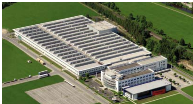
Die Maschinenfabrik im Gebiet Aspach hat jetzt nicht nur viel mehr Fläche für Produktion und für Entwicklung, sondern auch ein weltweit fast einzigartiges Schulungs- und Kompetenzzentrum: Dort können Kunden gemeinsam mit den Handtmann-Experten ihre speziellen Lösungen für die Lebensmittelherstellung entwickeln.