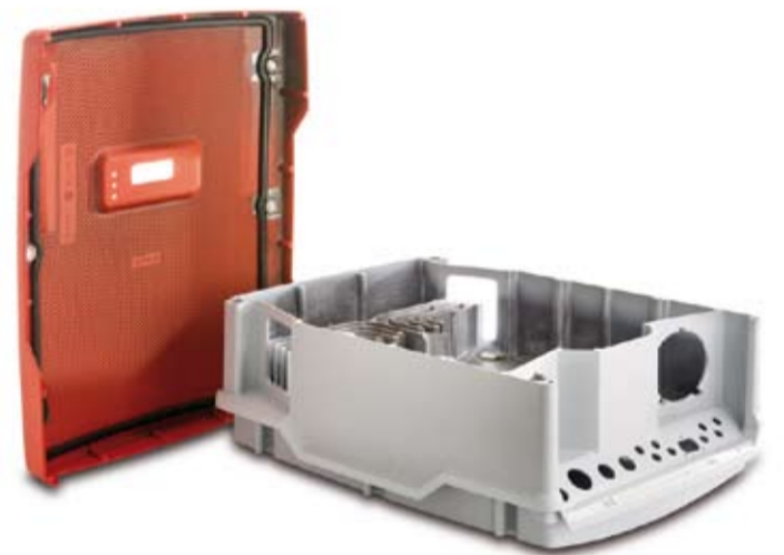
Handtmann produziert auch für den Umweltschutz, zum Beispiel Gehäuse und Deckel für Wechselrichter von Solaranlagen.