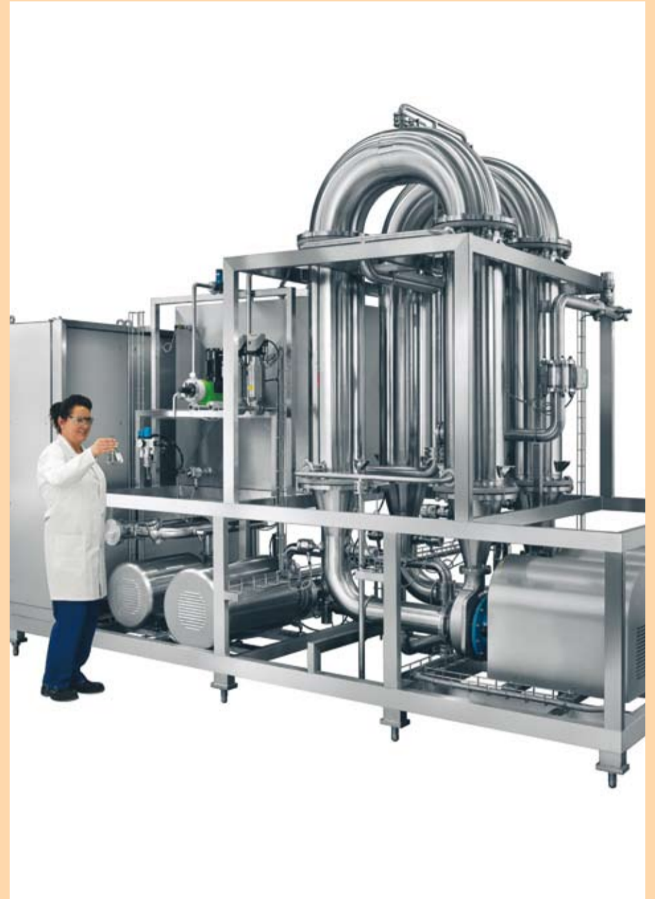
Neuentwicklung Laugenfiltration. Einsatzgebiet ist die gesamte Getränkeindustrie.

Etliche Anlagen sind bereits erfolgreich im Einsatz und tragen einen entscheidenden Beitrag für eine gleich bleibend hohe Produktqualität bei namhaften Kunden bei.