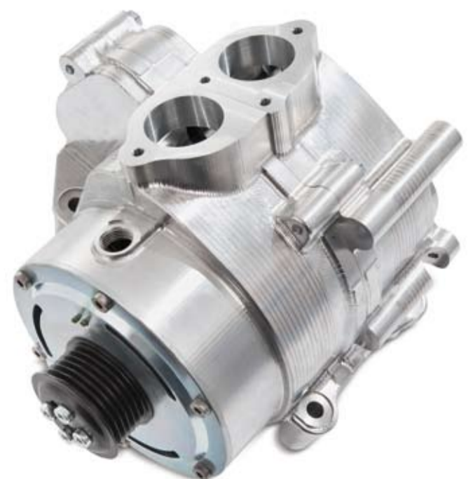
Der Handtmann-Spirallader steigert die Leistung bei unterschiedlichen Motorenkonzepten und verringert gleichzeitig Verbrauch und Schadstoffausstoß.

Als weiterer aktiver Beitrag zum Klimaschutz dürfen die innovativen Abgaskühlerkonzepte der Handtmann Systemtechnik gelten. In ihren unterschiedlichen Ausführungen kühlen sie das heiße Abgas um mehrere hundert Grad herab. Das reduziert in der Folge die Verbrennungstemperatur und somit die NO x -Emissionen um ein Vielfaches.