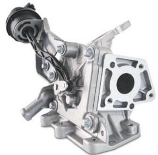
Aluminiumdruckgussteil für Dieselmotoren zur Verringerung der Schadstoffemissionen im Abgas. Gegossen in Annaberg, Systemmontage in Biberach